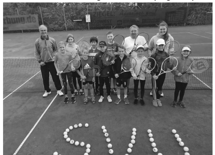
Teilnehmer und Trainer des Ferienprogrammunktes 2023

Beim Ferienprogrammpunkt der Tennisabteilung wurden den teilnehmenden Kindern die Grundtechniken des Tennis-Spiels gelehrt. Natürlich wurde dies von den Kids auch gleich um-