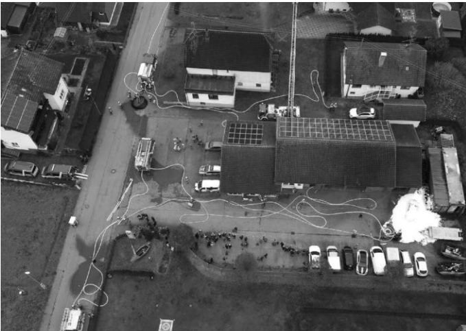
Gesamtes Einsatzgebiet im Überblick

Am vergangenen Samstag, 18.11.2023, übten die Feuerwehren aus Grundsheim, Unter- und Oberstadion bei der Werkstatthalle der Firma Autohaus Harscher in Grundsheim, die Zusammenarbeit bei einem angenommenen Brand eines Elektroautos in der Werkstatthalle und der Rettung von verschiedenen Verletzten. Unterstützt wurden die Winkelfeuerwehren mit der FW-Drehleiter aus Munderkingen und der Drohnenstaffel des Alb-Donau-Kreis.