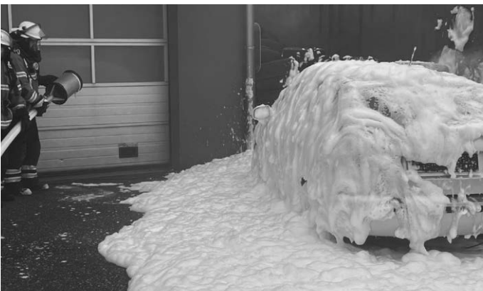
Autobrand gelöscht mit Schaum

Durch die Drohnenbilder können Glutnester bei einem Brand lokalisiert werden, auch evtl. weitere Verletzte Personen am Einsatzort können schneller durch den Rettungsdienst gefunden werden. Die Aufnahmen aus der Luft werden direkt auf einen Bildschirm bei der Einsatzzentrale übertragen.