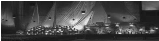
Seelsorgeeinheit Donau-Winkel, Evangelische Kirchengemeinden Rottenacker und Munderkingen

Nehmen Sie sich eine Stunde Zeit am Abend, um die wohlthuende Atmosphäre von Klang und Wort aufzunehmen und einen Ruhepunkt in dieser besonderen Zeit zu finden.