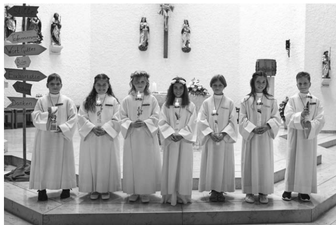
Kommunionkinder Unterstadion am 20.06.2021