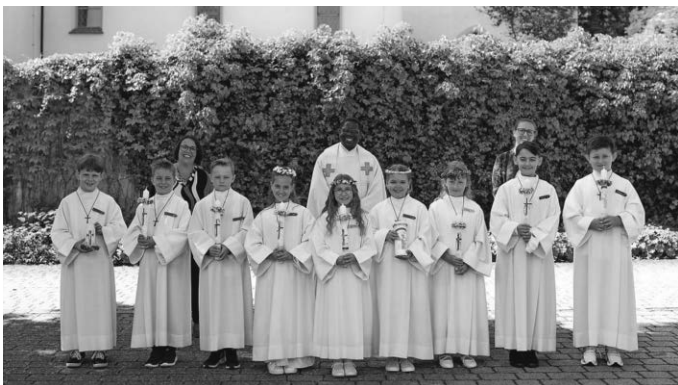
Kommunionkinder in Oberstadion am 13.06.2021