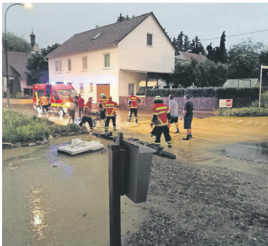
Einsatz in der Bühlstraße

In den vergangenen Nächten tobten mehrere Unwetter über das Gemeindegebiet von Oberstadion. Durch den Starkregen und den Sturm kam es zu insgesamt 20 Einsätzen der Freiwilligen Feuerwehr. Dabei waren Oberstadion mit Rettighofen und Hundersingen stärker betroffen, wie das restliche Gemeindegebiet.