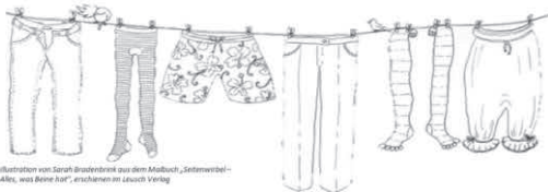
Illustration von Sarah Branderink zur dem Malbuch „Selbstweibel“ Alles, was keine Haut“, erschienen im Leuchtturm Verlag