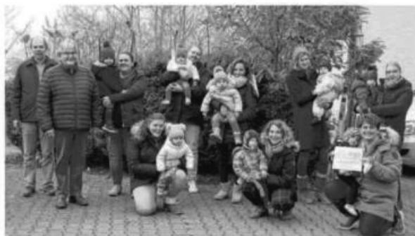
Die Krabbelgruppe aus Rottenacker übergibt einen Scheck an die Uganda-Initiative Bukoto-Schwaben.

Ganz anders sieht es für die meisten Kinder in Uganda aus. Durch den südlichen Teil des Landes in Ostafrika verläuft der Äquator. In den vergangenen Jahren sind in dem